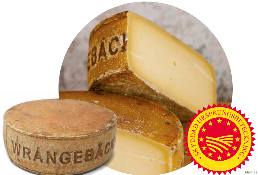
Wrångebäckosten från Almnäs Bruk strax utanför Hjo har som första ost i Norden fått en Skyddad ursprungsbeteckning .