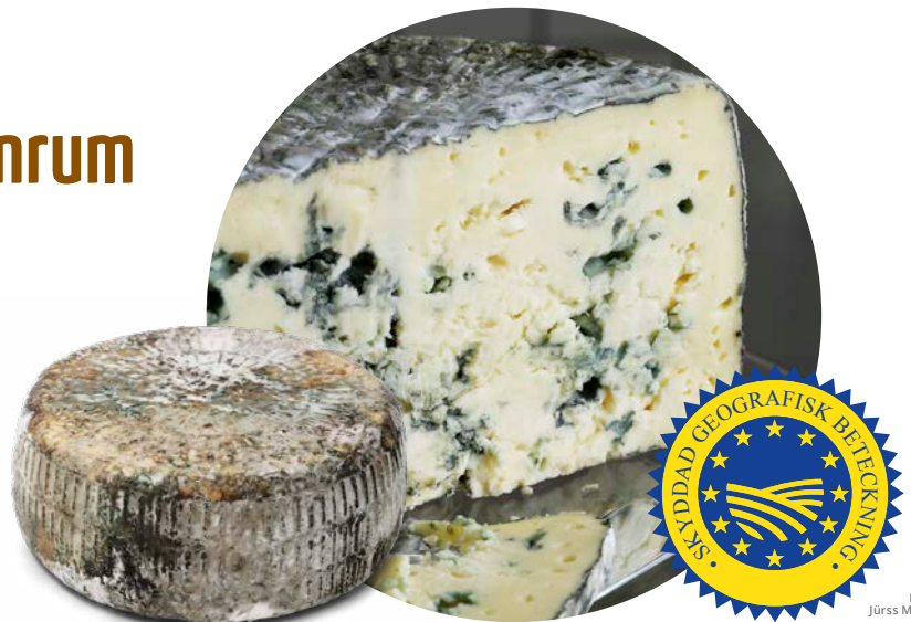
Sörmlands Ädel från Jürss Mejeri i Hälleforsnäs har en Skyddad geografisk beteckning

Den som uppfyller kraven för en skyddad beteckning placerar sig i samma fina sällskap som till exempel franska Roquefort, italienska Parmigiano Reggiano (parmesan) och schweiziska Gruyère.