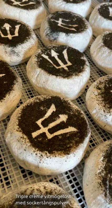
Triple crème vitmögölost med sockertångpulver