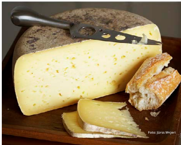
Hård grynpipeg ost