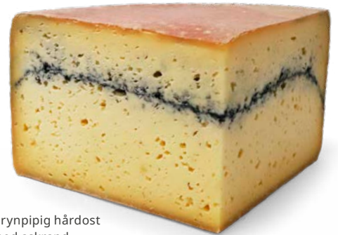
Grynpipeg hårdost med askrand

Ja, mat och matlagning vore fattigare utan ost. Och det allra bästa är att vad man än ska äta så finns minst en svensk hantverksost som passar utmärkt att jobba med.