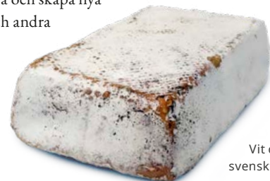
Vit caprin – tidigt svenskt osthantverk

Bland dagens svenska hantverksmejerier finns en enorm spännvidd. Dels hittar du typiska gårdsmejerier på landsbygden, med egen djurhållning. Med det finns också urbana ysterier som hämtar mjölk och producerar ett stenkast från stadskärnan. Även filosofi och inriktning skiljer mycket mellan olika producenter. Vissa arbetar för att förvalta och förfina svensk eller kontinental ostkultur medan andra fokuserar mer på att innovera och skapa nya varianter på ost och andra mejeriprodukter.