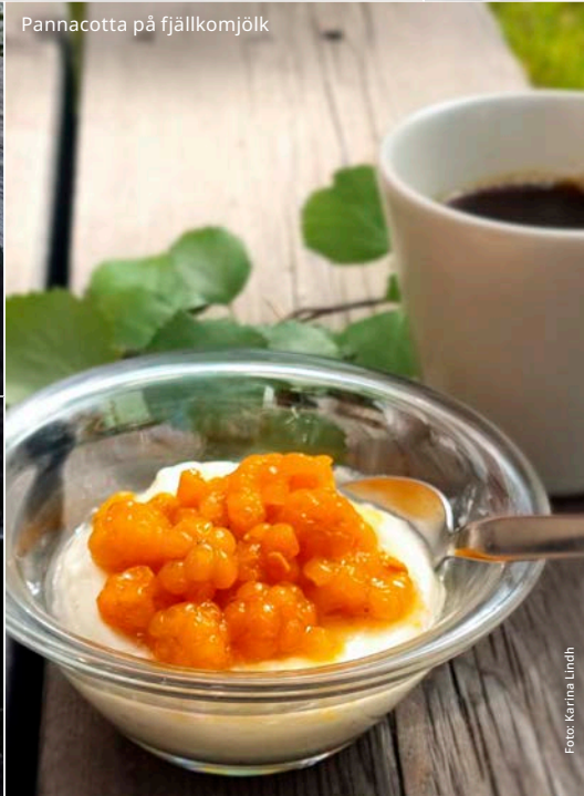
Pannacotta på fjällkomjök