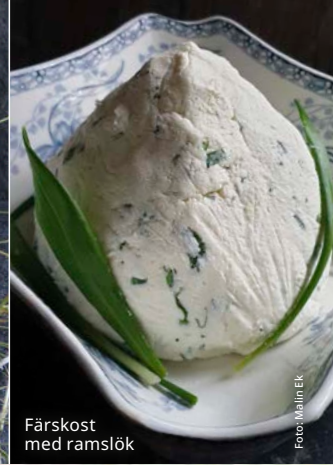
Färskost med ramlök