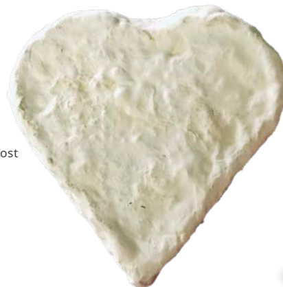
Mjuk kittvättad ost